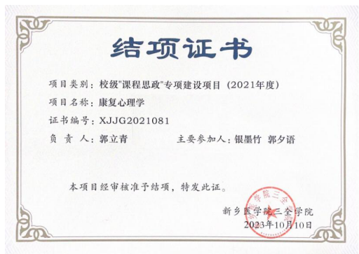
图 11 结项证书展示