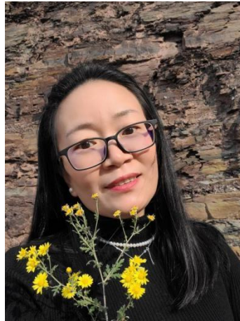
图 1 教师风采