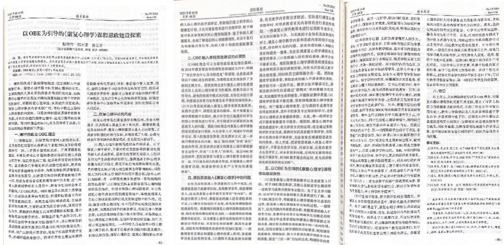
图 10 论文展示