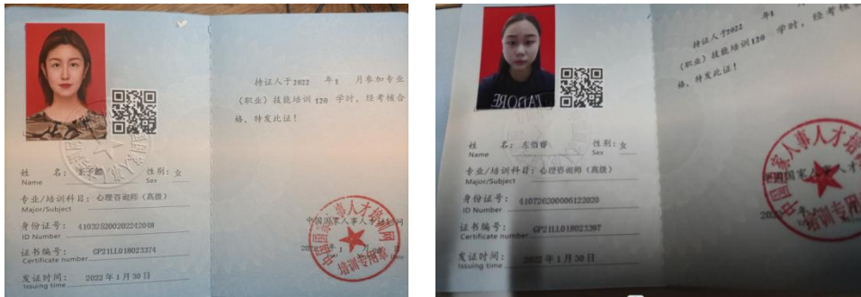
图 13 学生考取心理咨询师