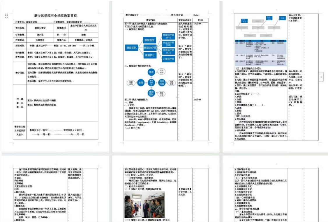
图 3 融入思政元素的教案