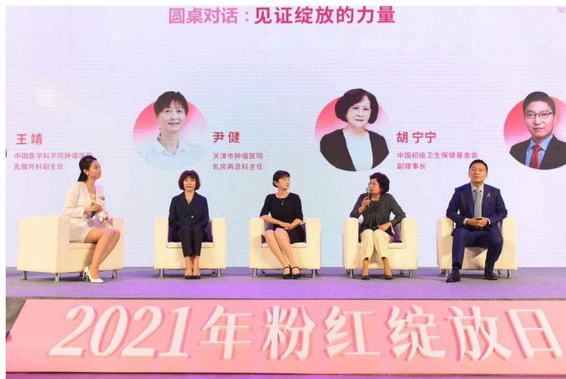
图8 《看我，看见我》宣传