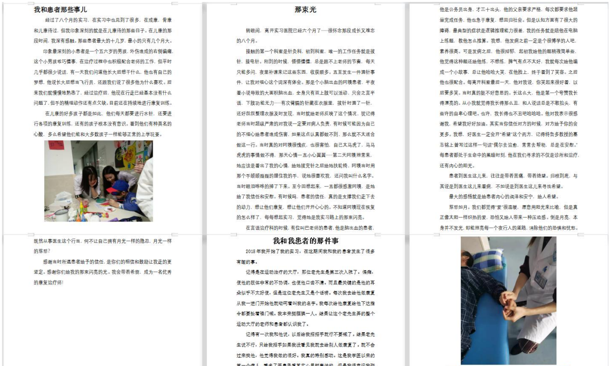
图 5 康复心理学课堂分享

关注心理状况现在是一个非常热门的话题，因此康复心理学在大学的开展对以后的工作还是现在的学习都有重大的意义。美国散文家作家、诗人爱默生说过“健康是人生第一财富”，其健康的含义也不仅仅局限于身体健康，也应包括心理等方面的健康，而心理健康是一个相对概念，没有绝对的心理健康，也没有绝对的心理不健康，通过康复心理学的学习，我受益匪浅。