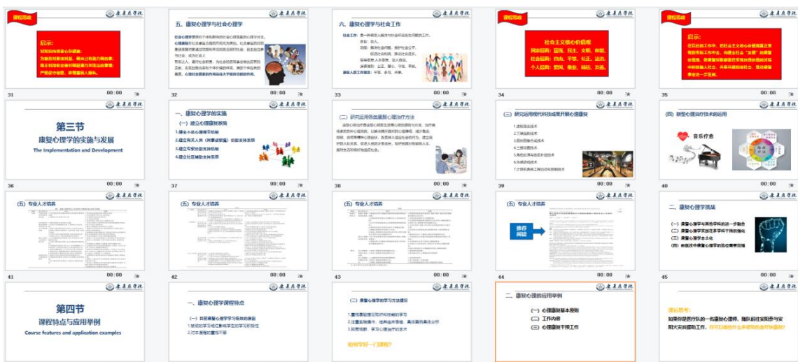
图 4 融入思政元素的 PPT