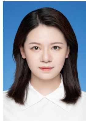
图 2 教师风采